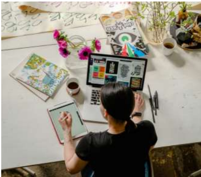
Рисунок 2. Применение цифровых технологий в художественно-творческой деятельности студентов в условиях STEAM-образования

Полученные результаты показали, что использование элементов STEAM-подхода способствует активизации познавательной деятельности студентов, повышает их интерес к учебному процессу и стимулирует творческую инициативу. Во время выполнения практических заданий по живописи студенты демонстрировали более осознанный подход к решению художественных задач, активно экспериментировали с цветом, композицией и